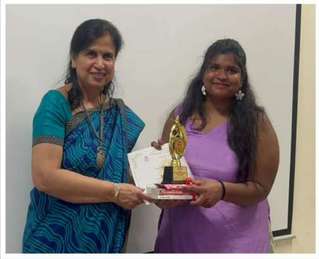
60 सेकंड प्रतियोगिता में कॉमस्केप की झलकियाँ Glimpses from COMSCAPE in 60 Seconds Competition